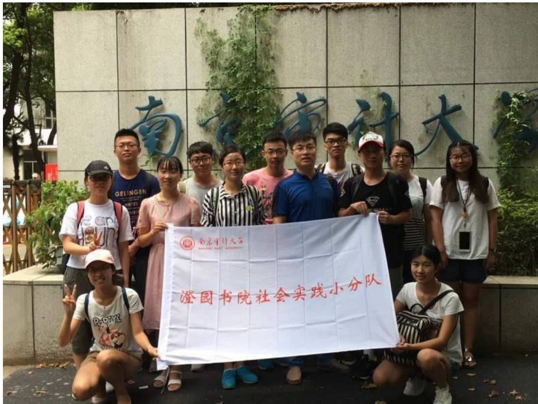
图：澄园书院盐城组（左）和淮盐组（右）合影