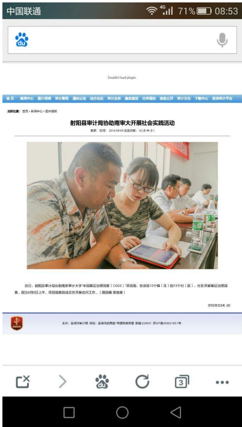
图：盐城市审计局报道盐城组调研，初始版本