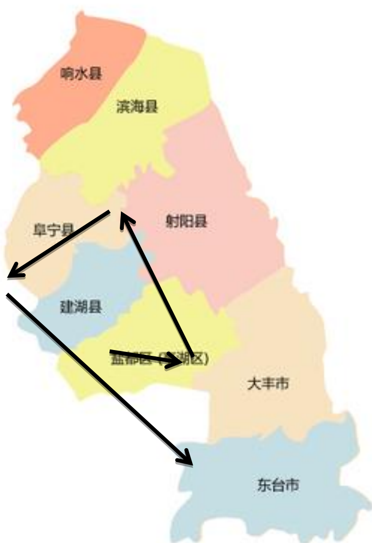
图：盐城组调研路线图

此次调查问卷，我们组涉及盐城两个县、一个市和三个区，即射阳县、建湖县、东台市、大丰区、亭湖区和盐都区。我们调研的顺序为亭湖区、盐都区同时进行，之后分别去往大丰区、射阳县、建湖县和东台市。调研顺序综合联络状况和地理位置进行。