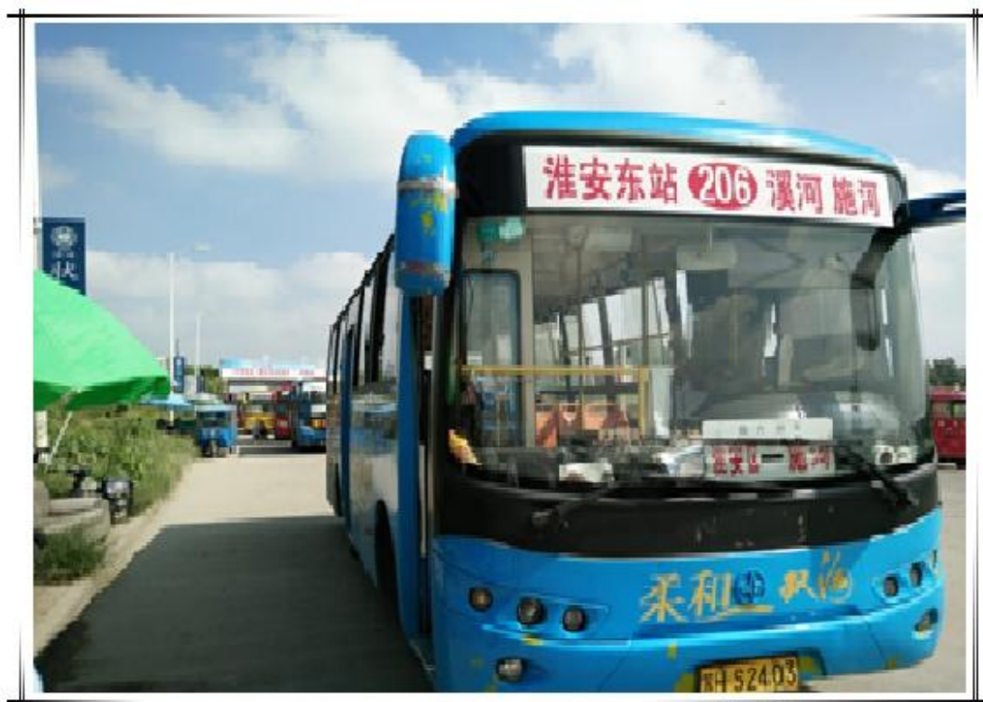
团队成员乘坐乡镇公交前往样本点调研

的黄桥村，给出的拒访理由是“工作忙，没空”。后来我们了解到：此村的行政区划发生了改变，正在进行“村改居”，其辖区是政府规划的一块新城，所以村干部目前在忙“拆迁”和“安置”工作。淮安区是我们小组调研的第一站，第一次遇到“拒访”对队员的士气是一个打击，但我们并没有放弃，我和队员始终相信“精诚所至，金石为开”。接下来我们没有发起“手机轰炸”战略，几乎每天一个电话，对村干部“动之以情晓之以理”，但他们并不领情，最后见到使我们的电话号码，直接就挂断了。很遗憾，虽然我们努力去挽回，但这个样本点最终还是被“拒访”，使得我们组最终只完成了 74 个点，这不得不说是一种遗憾。