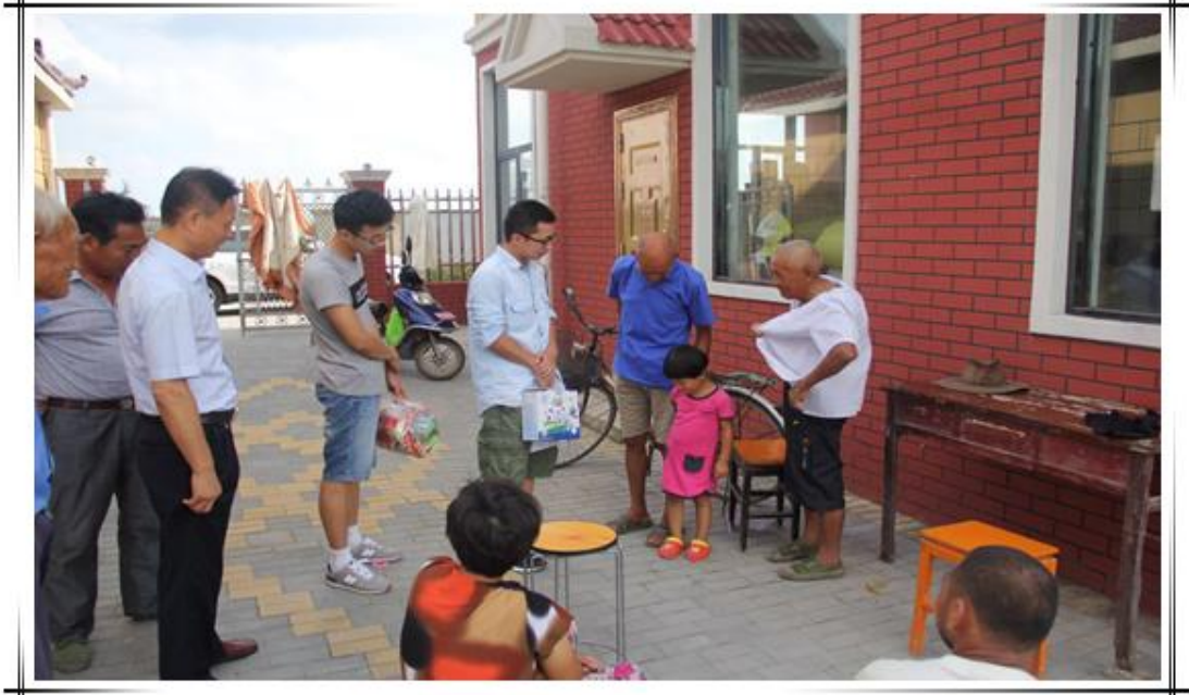
淮盐组深入盐城阜宁成俊村灾区爱心捐助