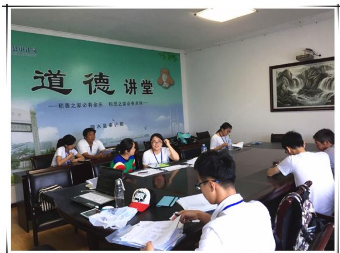
队员正在进行一对一采集数据

知道”几乎在每份问卷中都有出现。由于本次调查的问卷中包含了很多“数字填空题”和“概念题”，这些题往往会把受访者问懵，在“数字填空题”上，受访者往往不能说出准确数字，有些甚至连估计都估计不出来；而在“概念题”中，限于基层干部的文化水平普遍不高，导致他们听不懂一些学术性很强名词，从而不能理解题目的含义，使得答案可能不能表达本意。在我们调研的第一站—淮安区以上问题在我们问卷过程中就频频出现，这引起了我们团队的关注。为了就在后面的问卷中减少这种现象的发生，经过小组内部沟通以及咨询西财老师后我们想出了一套解决办法：首先，在对受访者正式问卷之前和他们大概说明一下我们问卷的模块和内容，并建议受访者带上关社区的一些资料以备查阅；