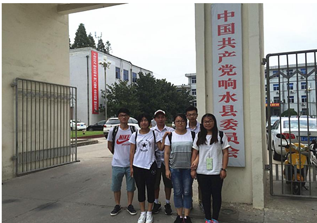
淮盐组全体成员在响水县委合影